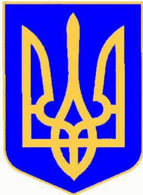
ДЕРЖАВНИЙ ГЕРБ УКРАЇНИ (кольорове та чорно-біле зображення)

Конституція України, прийнята 28 червня 1996 р., затвердила тризуб як малий герб нашої держави. Ним став золотий Тризуб на синьому щиті.